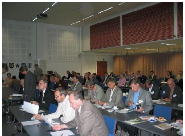
Kuva: Metsäbiomassasta uusia tuotteita -seminaarista

Selvitysten raportit ovat julkisia, ne tullaan julkaisemaan OSKE:n nettisivuilla helmikuun aikana. Selvitysten pohjalta on suunnitteilla aiheisiin liittyviä jatkohankkeita.